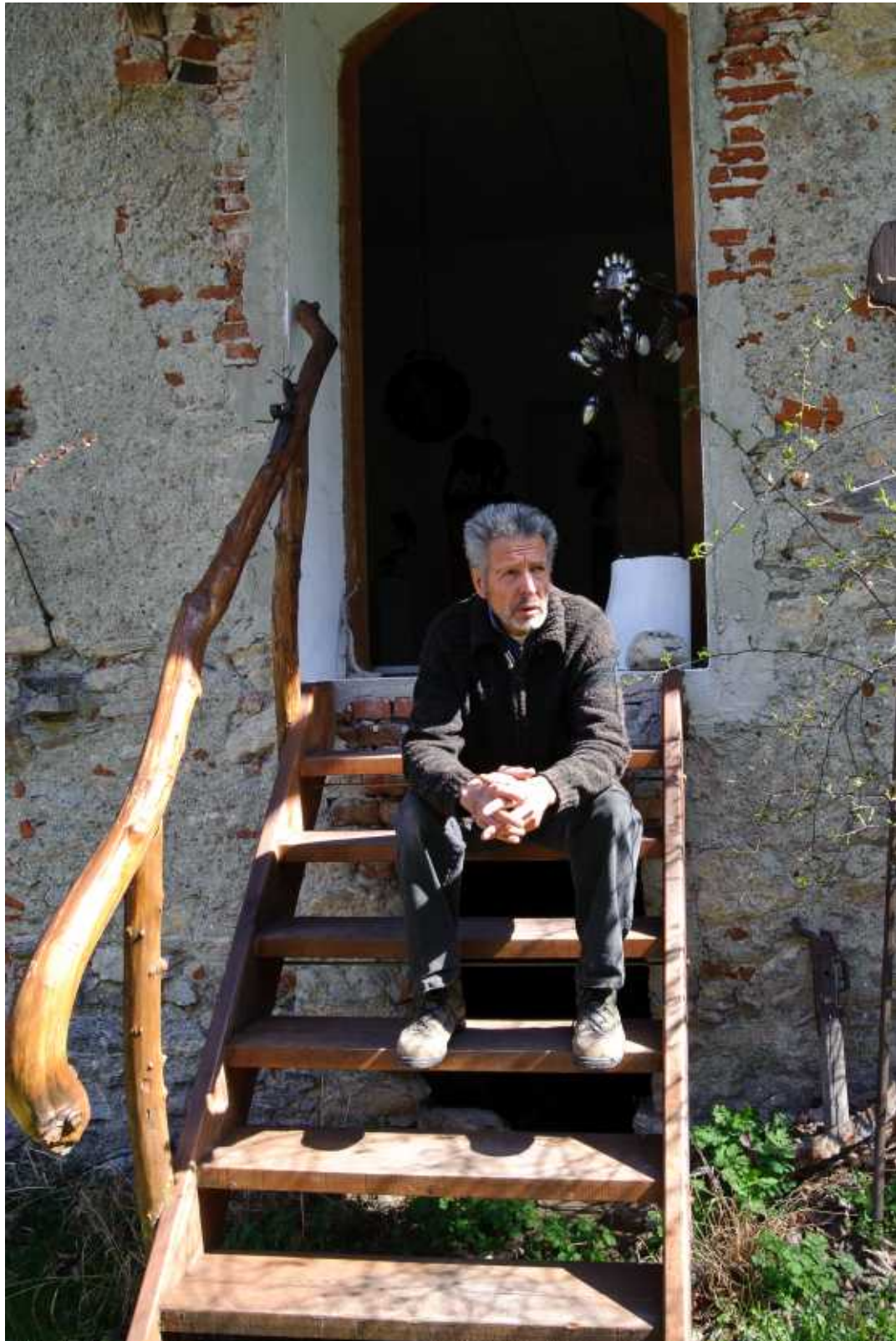
Der Künstler vor seinem Atelier im März 2012